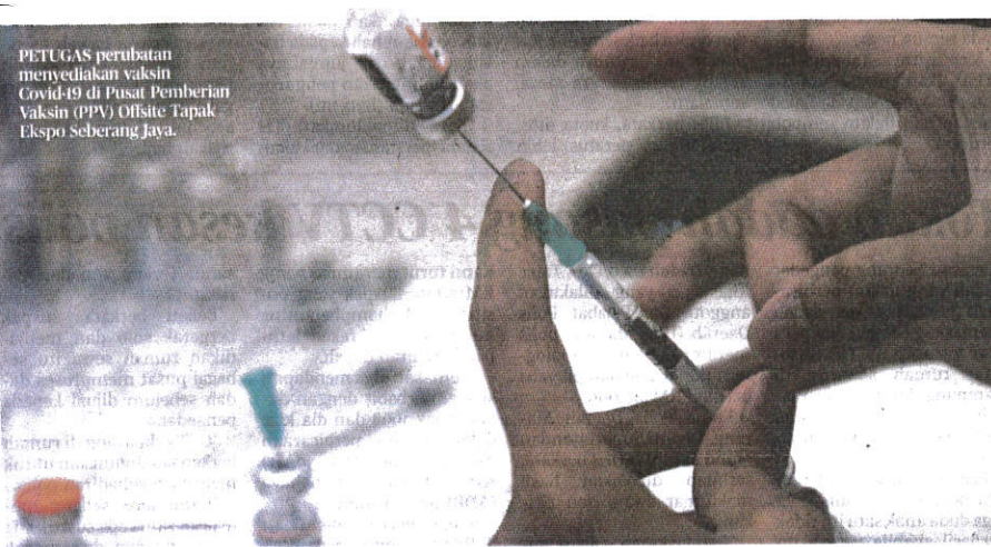
PETUGAS perubatan menyediakan vaksin Covid-19 di Pusat Pemberian Vaksin (PPV) Offsite Tapak Ekspo Seberang Jaya.