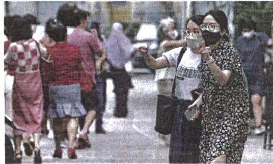
Mask up: Members of the public wearing face masks outdoors in Kuala Lumpur.

Previously, only individuals who had received their booster shots were exempted from a home sur-