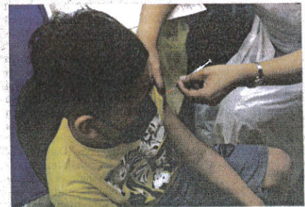
PETUGAS perubatan memberikan suntikan vaksin Covid-19 kepada seorang kanak-kanak di Pusat Pemberian Vaksin (PPV) Offsite Tapak Ekspo Seberang Jaya.

Sementara itu, menurut portal GitHub Kementerian Kesihatan, 16 kematian akibat Covid-19 dilaporkan kelmarin dengan Pulau Pinang merekodkan jumlah tertinggi iaitu empat kes diikuti Kedah dan Perak masing-masing tiga kes, Johor dan Selangor masing-masing mencatatkan dua kes manakala satu kes masing-masing di Sabah dan Kuala Lumpur.